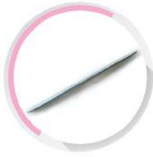
สปริงติดท่อ-ร้อยสาย สีขาว (BS) 16-32 มม. (3/8'-1')