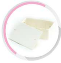
กล่องพักสายสี่เหลี่ยม 4x2 (164x77x50) สีขาว (BS) 20x2, 25x2 มม. (1/2"x2, 3/4"x2)