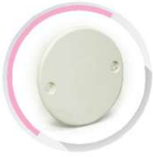
ฝาปิดกล่องพักสายกลม สีขาว (BS) 16-20-25 มม. (3/8'-1/2'-3/4')