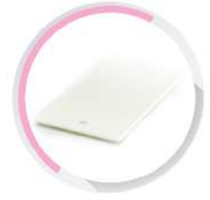
ฝาปิดกล่องพักสายสี่เหลี่ยม 4x4 สีขาว (BS) 100x75, 147x86, 164x77 มม. (4"x3', 5 3/4"x3 1/2', 6 1/2"x3')