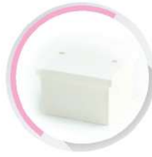
กล่องพักสายสี่เหลี่ยมหนา 4x4 (86x86x46) สีขาว (BS) 20-25 มม. (1/2'-3/4')