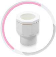
ตัวแปลงข้อต่อเข้ากล่อง BS เป็น JIS สีขาว 16-25 มม. (3/8"-3/4")