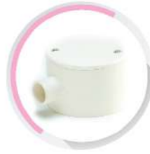
กล่องพักสายกลม 1 ทาง สีขาว (BS) 16-25 มม. (3/8"-3/4")