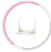
คลิปก้ามปู-ร้อยสาย สีขาว (BS) 16-40 มม. (3/8"-1 1/4")