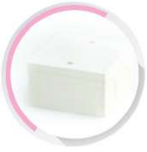
กล่องพักสายสี่เหลี่ยม 4x4 (86x86x40) สีขาว (BS) 20-25 มม. (1/2'-3/4')