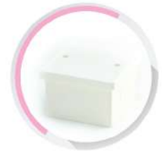
กล่องพักสายสี่เหลี่ยมมีลิคฝั่งผนัง 4x4 (77x77x48) สีขาว (BS) 20-25 มม. (1/2'-3/4')