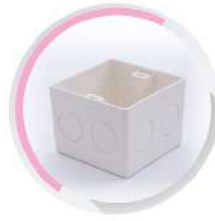
กล่องพักสายสี่เหลี่ยมฝั่งผนัง 3"x3'-ร้อยสาย สีขาว (BS) 16-20-25 มม. (3/8'-1/2'-3/4')