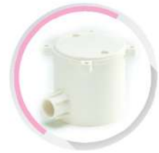
กล่องพักสายกลมเล็ก 1 ทาง สีขาว (BS) 16-25 มม. (3/8"-3/4")