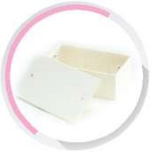
กล่องพักสายสี่เหลี่ยม 4x2 (164x77x38) สีขาว (BS) 16x2, 20, 25 มม. (3/8"x2, 1/2', 3/4')