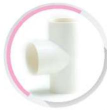
สามทาง-ร้อยสาย สีขาว (BS) 16-50 มม. (3/8"-1 1/2")