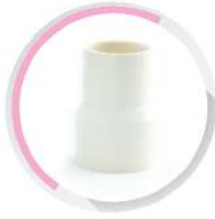
ข้อต่อตรงลด ร้อยสาย สีขาว (BS) 20x16-50x40 มม. (1/2x3/8"-1 1/2x1 1/4")