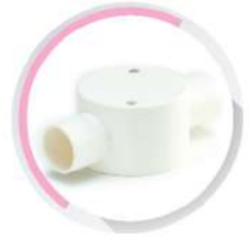
กล่องพักสายกลม 2 ทางผ่าน สีขาว (BS) 16-25 มม. (3/8"-3/4")