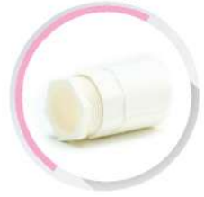
ข้อต่อเข้ากล่อง-ร้อยสาย สีขาว (BS) 16-50 มม. (3/8"-1 1/2")