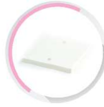
ฝาปิดกล่องพักสายสี่เหลี่ยม 4x4 สีขาว (BS) 75x75, 86x86 มม. (3"x3', 3 1/2"x3 1/2')