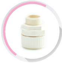
ข้อต่อตรง-ลูกฟูก ร้อยสาย สีขาว (BS) 16-32 มม. (3/8"-1")