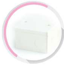
กล่องพักสายสี่เหลี่ยมมีลิค 4x4 (86x86x54) สีขาว (BS) 20-25 มม. (1/2'-3/4')