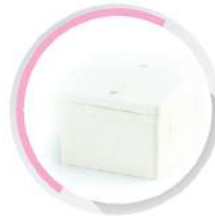
กล่องพักสายสี่เหลี่ยมฝั่งผนัง 4x4 (77x77x38) สีขาว (BS) 20-25 มม. (1/2'-3/4')