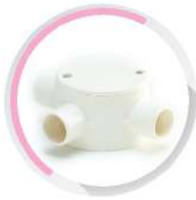
กล่องพักสายกลม 3 ทางที่ สีขาว (BS) 16-25 มม. (3/8"-3/4")