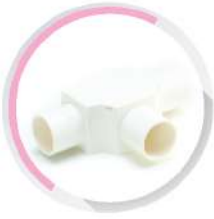
สามทางฝาเปิด-ร้อยสาย สีขาว (BS) 20-32 มม. (1/2"-1")