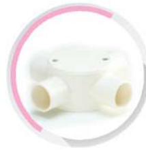
กล่องพักสายกลม 4 ทาง สีขาว (BS) 16-25 มม. (3/8"-3/4")