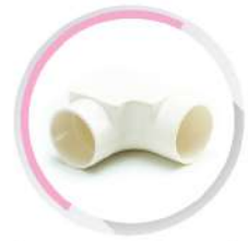
ข้องอ 90° ฝาเปิด-ร้อยสาย สีขาว (BS) 20-50 มม. (1/2"-1 1/2")