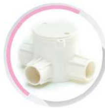
กล่องพักสายกลมเล็ก 3 ทางที่ สีขาว (BS) 16-25 มม. (3/8"-3/4")