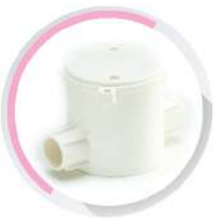
กล่องพักสายกลมเล็ก 2 ทางผ่าน สีขาว (BS) 16-25 มม. (3/8"-3/4")