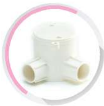
กล่องพักสายกลมเล็ก 2 ทางมุม สีขาว (BS) 16-25 มม. (3/8"-3/4")