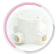
กล่องพักสายกลมเล็ก 4 ทาง สีขาว (BS) 16-25 มม. (3/8"-3/4")