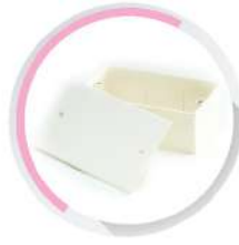
กล่องพักสายสี่เหลี่ยม 4x2 (141x77x50) สีขาว (BS) 20 มม. (1/2')