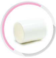
ข้อต่อตรง-ร้อยสาย สีขาว (BS) 16-50 มม. (3/8"-1 1/2")