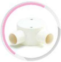
กล่องพักสายกลม 2 ทางมุม สีขาว (BS) 16-25 มม. (3/8"-3/4")