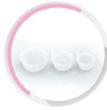
ปลั๊กอุดรู สำหรับ กล่องพักสาย สีขาว (BS) 16-25 มม. (3/8'-3/4')