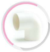
ข้องอ 90°-ร้อยสาย สีขาว (BS) 16-50 มม. (3/8"-1 1/2")